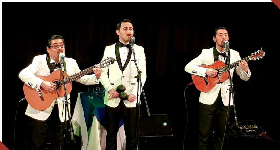
Figura 1: concierto de La Flor del Recuerdo, el 03/08/2019, en la Gran Logia de Santiago de Chile.

El grupo musical La Flor del Recuerdo también juega con la idea de retroutopía. Inicialmente, hay que comentar la estética del grupo: esmóquines blancos, pelo engominado, bigotes finos bien cuidados y micrófonos antiguos (véase Figura 1).