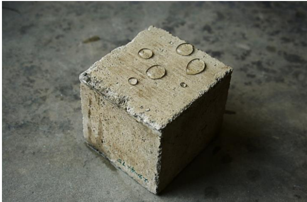
Fig. 1. Bloque de concreto con emulsión de parafina

coeficiente de absorción capilar pequeño y una resistencia a la penetración de agua grande, Fig.1, sería más durable que uno de concreto convencional porque dificulta la penetración de agentes agresivos que producirían su degradación.