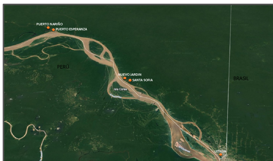
Figura 1. Ubicación de los municipios y comunidades del área de estudio

Esta investigación se desarrolló a través de un enfoque cualitativo y se llevó a cabo en la ribera del Río Amazonas, entre los municipios de Leticia y Puerto Nariño, como se presenta en la figura 1. En estas entidades territoriales se contactaron, principalmente, a las instituciones municipales y departamentales encargadas del tema de salud pública. Adicionalmente, se contó con la participación de tres comunidades indígenas: Nuevo Jardín y Santa Sofía, las cuales están ubicadas a 29 y 30 km de Leticia, respectivamente, y se encuentran bajo la jurisdicción administrativa de este municipio. La comunidad de Puerto Esperanza, se localiza a 63 km de Leticia y hace parte de la jurisdicción administrativa de Puerto Nariño.