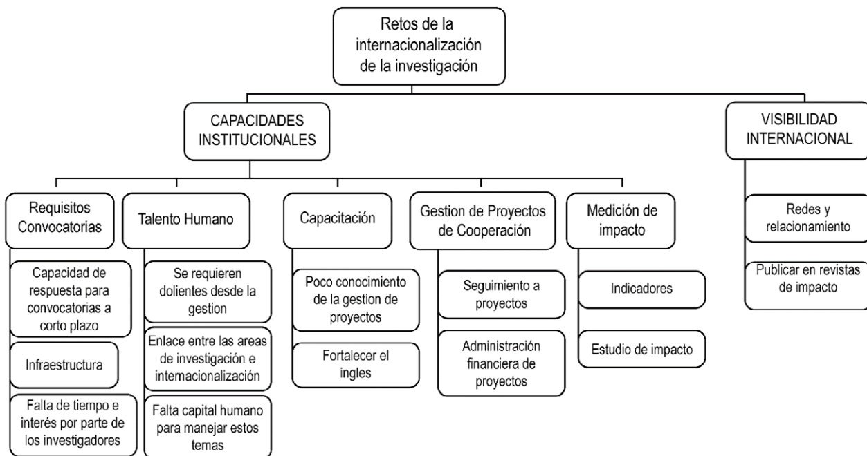
Figura 2. Retos de la internacionalización de la investigación

“El cumplimiento de los requisitos para algunas convocatorias internacionales: piden muchas veces temas de infraestructura que no tenemos y por eso nos perdemos las convocatorias” (Participante 6, comunicación personal, 17 de diciembre de 2021).