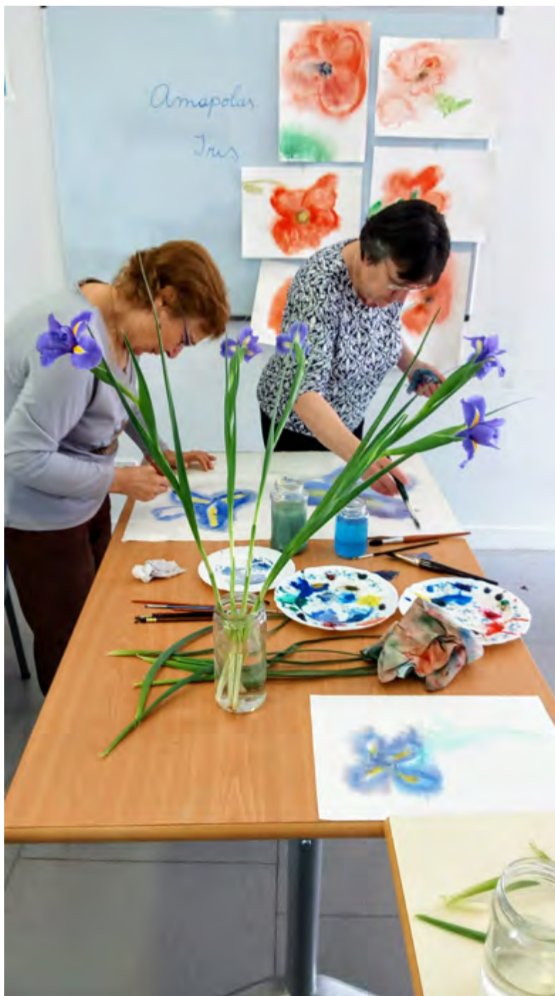
Autora: Adelaida Larrain