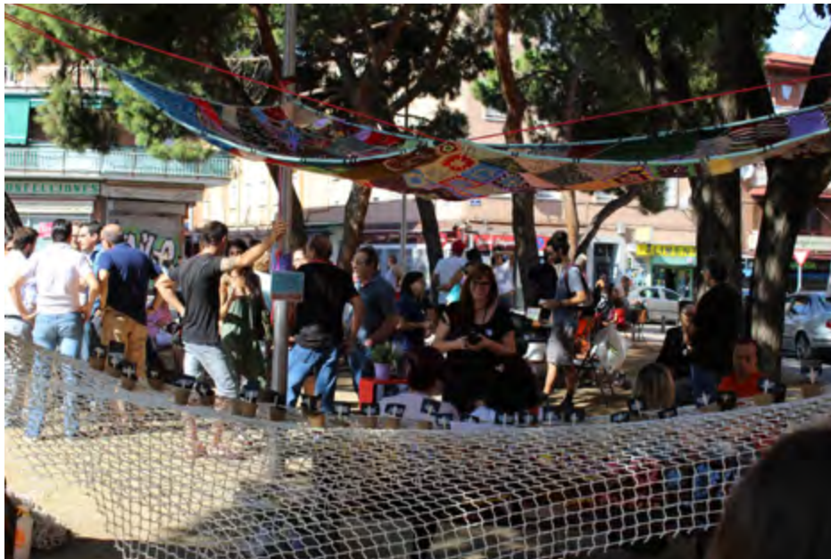
Figura 2. Fiesta vecinal, ARTYS. La Experimental, 2019.