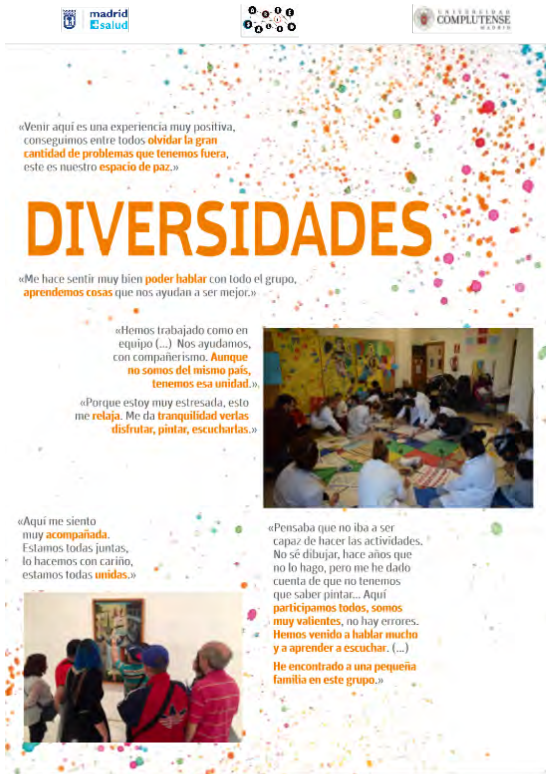
Figura 5. Cartel de la exposición Arte, Salud y Cuidados , realizada en 2019 en el Centro Dotacional Integrado de Arganzuela, Madrid.