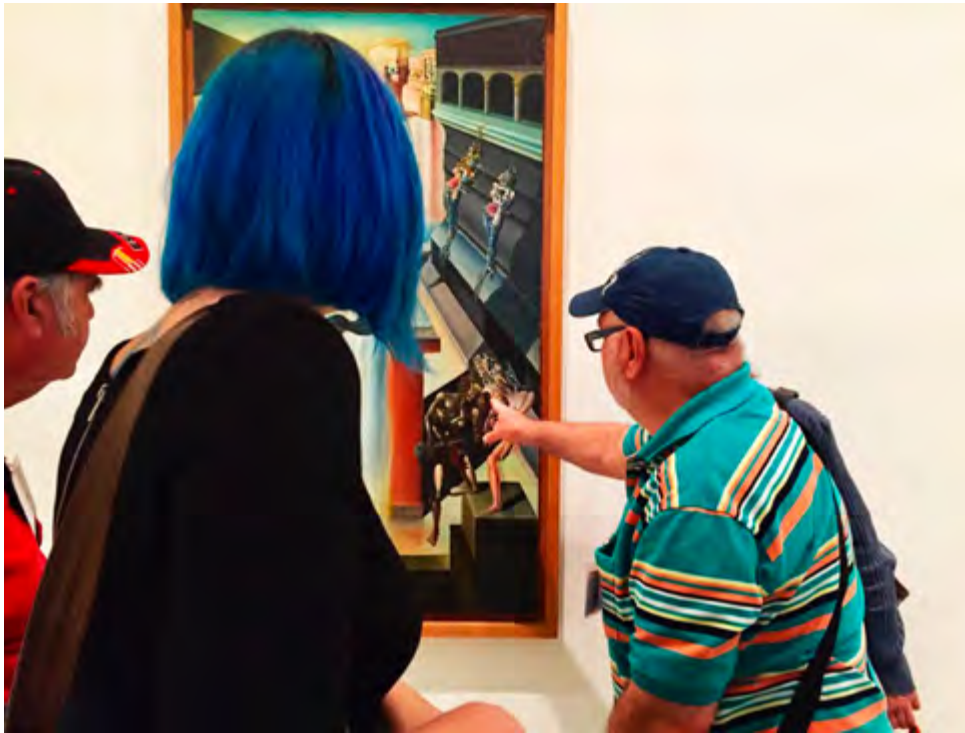
Figura 6. Visita del Proyecto ARVICO al Museo Nacional Centro de Arte Reina Sofía, 2018.