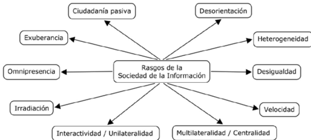
Figura 1. Rasgos de la sociedad de la Información. Adaptado de Trejo Delarbre (2001).

La actual sociedad, denominada por algunos como sociedad de la información (Valenti López, 2002) y por otros como sociedades de conocimiento (UNESCO, 2005), presenta, desde su misma estructura, grandes posibilidades y retos en el ámbito educativo (Monsalve Gómez, 2013). Algunos de estos retos se pueden analizar desde los rasgos que caracterizan la Sociedad de la Información propuestos por Trejo Delarbre (2001) los cuales se presentan en la Figura 1.