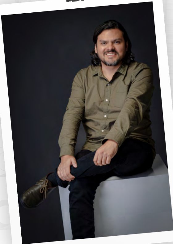
Fotógrafo Carlos Corredor Lopera

Director (2023-2024) colección Scripta Exducere