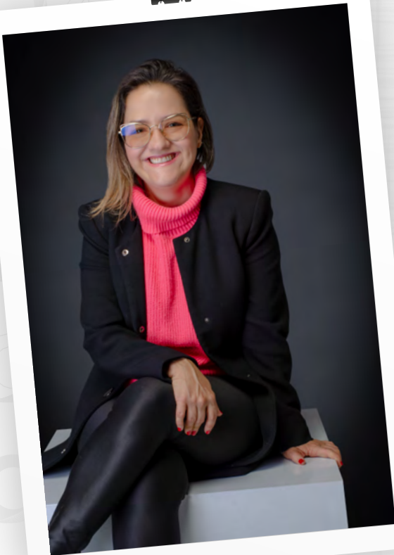
Fotógrafo Carlos Corredor Lopera

Directora (2022-2024) Colección Jurídica